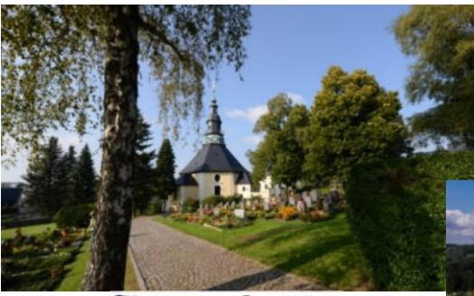
Kurort Seiffen www.seiffen.de